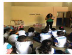
PROJETO VIDA NOVA NA ESCOLA