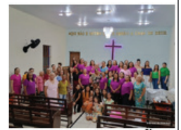
CULTO DE GRATIDÃO DIA INTERNACIONAL DA MULHER

Não a nós, Senhor, não a nós, mas ao teu nome dá glória, por amor da tua fidelidade. (Sl. 115-1)