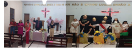
Culto de Adoração! Eu vivo, porque ELE vive!