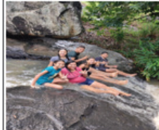
EVENTO COM ADOLESCENTES